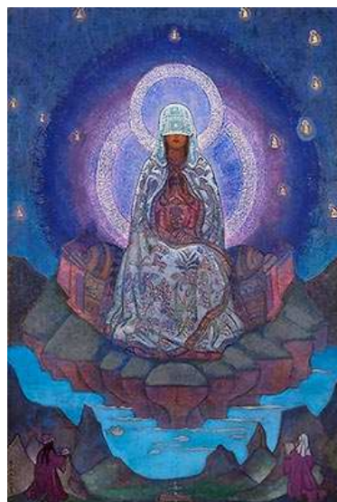
Mère du Monde de Nicolas Roerich